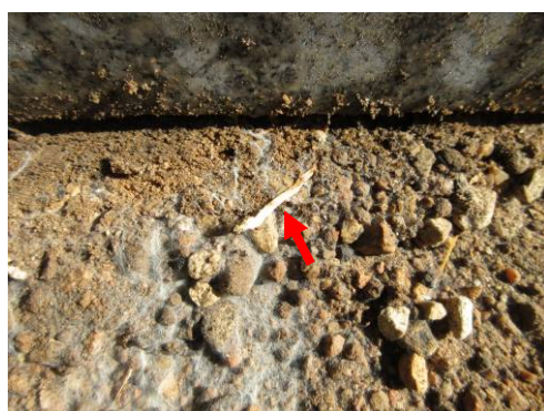
今年新たに発根した根