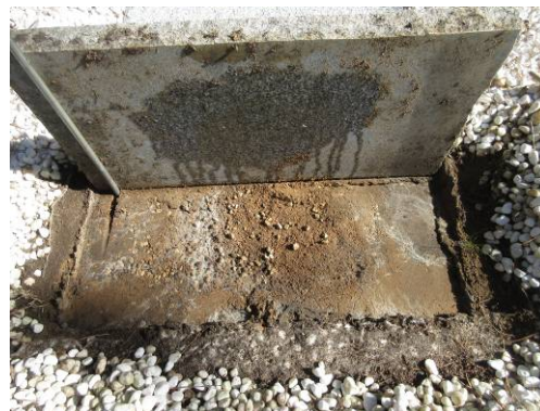
石板裏は予想通り結露