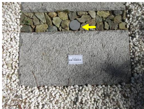
確認した石板と発根確認管

発根確認管に一番近い石板下を確認しています。この発根確認管内は深部まで均等に発根しており、石板下の土壌改良部を掘らずして根が多数伸長していることが推察出来ます。 この初期発根検知方法は特許取得済みです。