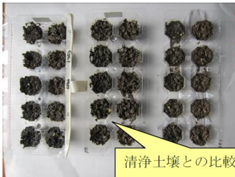
清浄土壌との比較試験