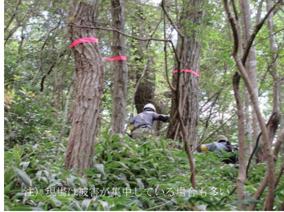
注）現場は被害が集中している場合も多い