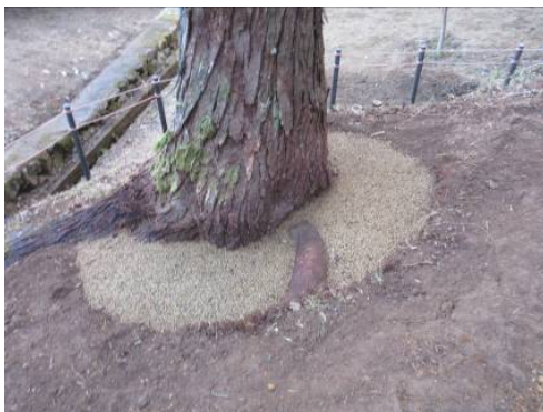
通気性資材で景観仕上げ完了